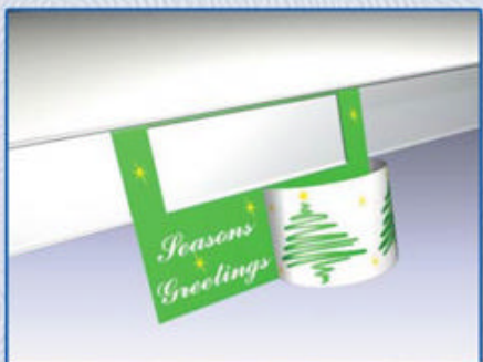
3D polcéli kommunikáció