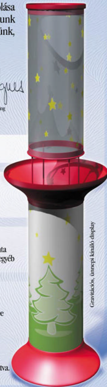
Gravitációs, ünnepi kínáló display

Az alap átmérője 250 mm. A kínáló tálca átmérője 455 mm. A display magassága 1600 mm. Az alsó és felső cylinder szita-nyomással van ellátva. Cikkszám: STC-250 x-mass